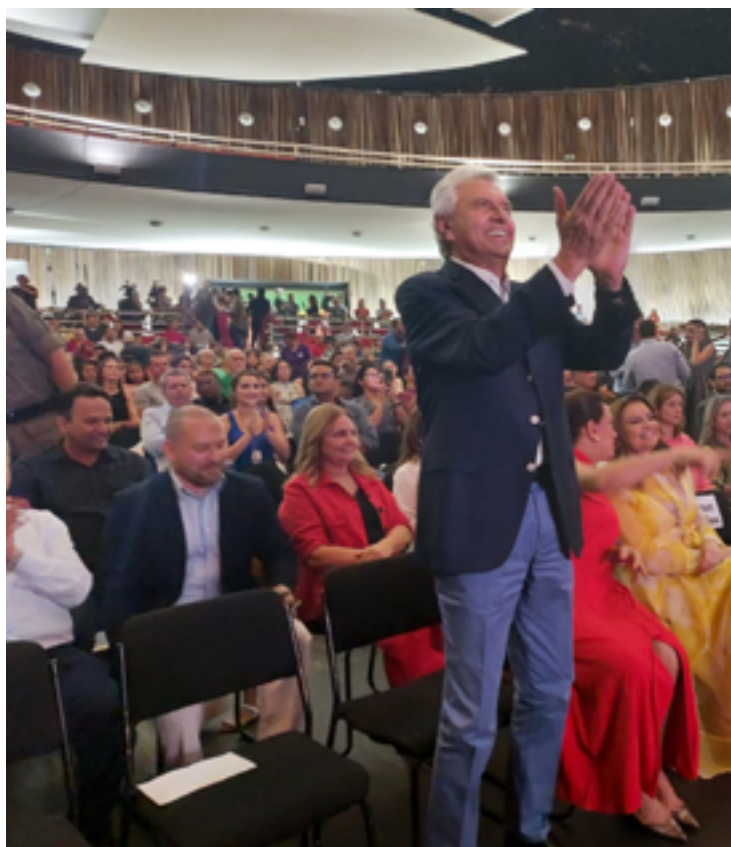
Ronaldo Caiado se emociona durante abertura do Natal do Bem, na noite de ontem, no Centro Cultural Oscar Niemeyer (CCON)