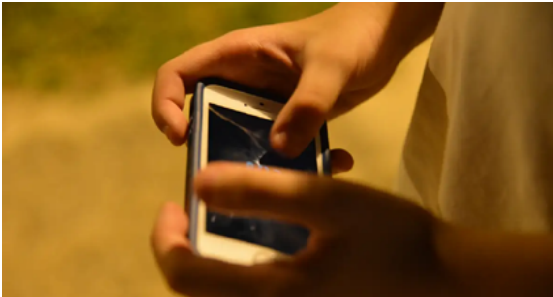
Velocidade de conexão piora quanto menor é o poder econômico

As classes C e D/E impulsionaram crescimento da conectividade nos domicílios brasileiros, passando de 56% para 91% e de 16% para 67%, respectivamente, entre os anos de 2015 e 2023