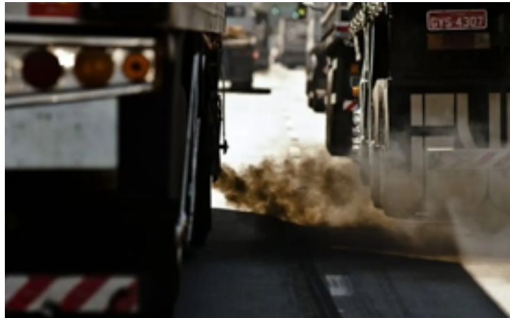
Concentrações médias globais de dióxido de carbono (CO2) ultrapassou 50% os índices pré-industriais

A concentração de gases de efeito estufa na atmosfera, responsável pelas mudanças climáticas, atingiu níveis recordes em 2022, uma tendência crescente que não parece se reverter