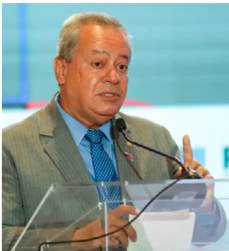
Vice-presidente e ministro do Desenvolvimento, Indústria, Comércio e Serviços, Geraldo Alckmin, lança o novo programa Brasil Mais Produtivo

para a consolidação da nova industrialização brasileira, é preciso pensar em encadeamento produtivo. “Não basta apenas pensar nas grandes empresas que podem produzir, podem melhorar sua produtividade, para melhorar a inovação e tecnologia, na abertura de mercados, com esse novo approach que vemos do governo, se nós não tivemos um encadeamento produtivo que permita competitividade em toda a cadeia. Nós precisamos permitir que a cadeia seja competitiva para que seja um processo sistêmico.”