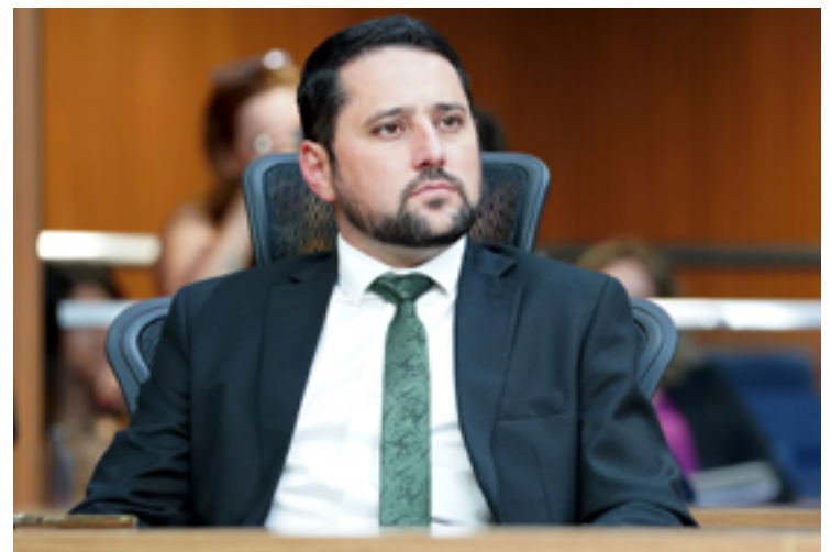
André do Premium: debate sobre lei orçamentária