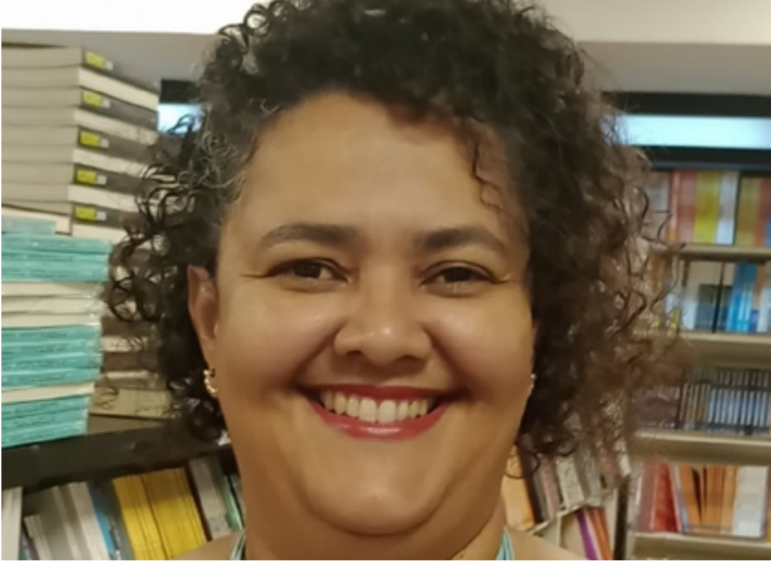
Autora fala sobre como letramento influencia na construção da identidade