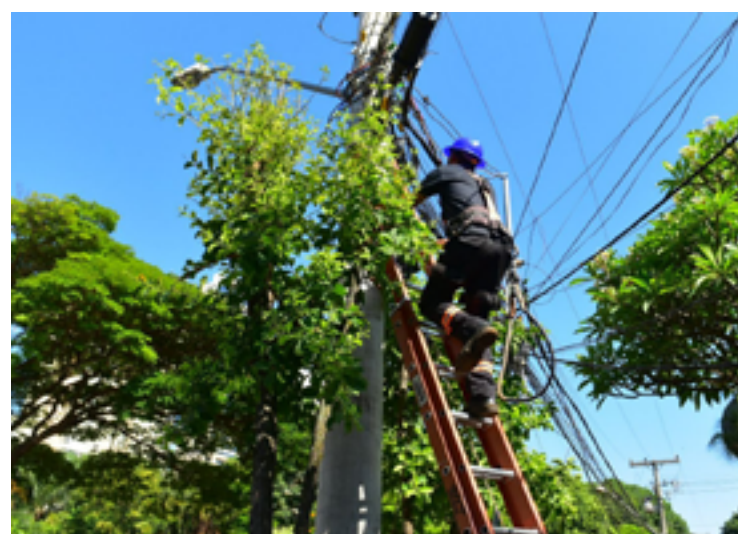
Projeto é uma parceria da Prefeitura, Ministério Público de Goiás (MP-GO) e empresas

Lançado em agosto deste ano, o programa Cidade Segura é uma parceria com o Ministério Público do Estado de Goiás (MP-GO) e empresas de telecomunicações, e conta com o apoio da Equatorial Goiás. O objetivo do projeto é reduzir a quantidade de fios nos postes da cidade, identificá-los e regularizá-los, aumentando a segurança da população.