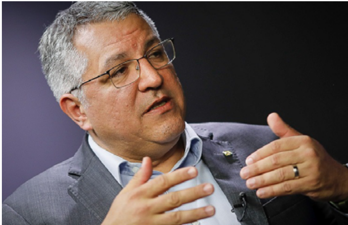
Alexandre Padilha: conter os gastos públicos e aumentar a arrecadação

A meta de déficit zero se tornou um assunto na política porque, no final de outubro, o presidente Luiz Inácio Lula da Silva