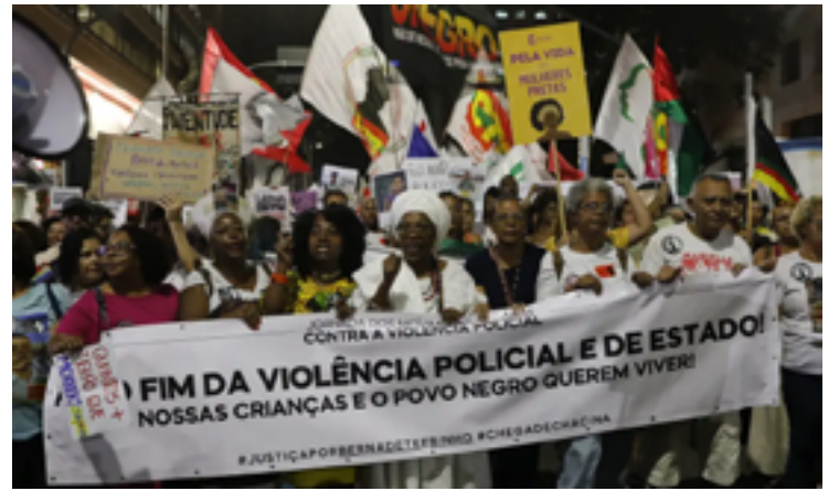
Proporção sobe para 87%, se considerados apenas aqueles com cor informada

cela dos mortos pelos policiais. Quando se comparam essas cifras com o perfil da população, vê-se que tem muito mais negros entre os mortos pela polícia do que existe na população. Esse fator é facilmente expli-