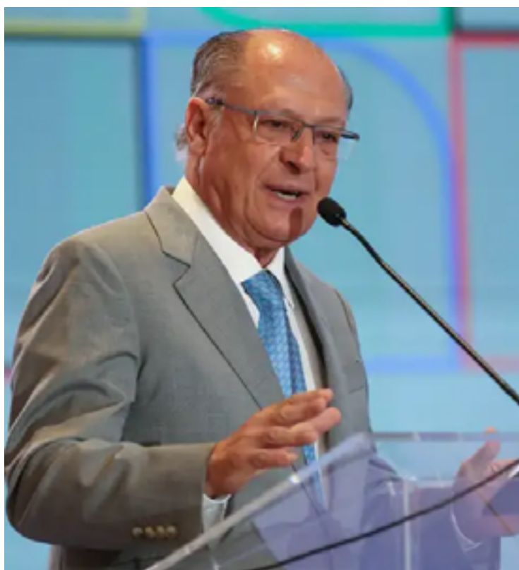
Vice-presidente e ministro do Desenvolvimento, Indústria, Comércio e Serviços, Geraldo Alckmin, lança o novo programa Brasil Mais Produtivo