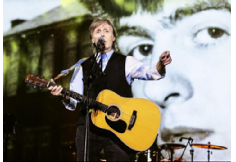
Multi-instrumentista: astro de 81 anos toca piano, violão e baixo Höfner