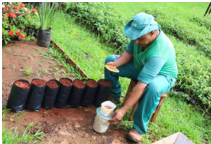
Prefeitura adere ao Virada Ambiental: parceria entre UFG e Amma promove plantio de mil mudas de árvores

Segundo a Prefeitura, o programa Selo de Sustentabilidade da Amma incentiva a participação de empresas que adotarem o Virada Ambiental com o plantio de mudas de árvores. “A intenção é estimular ainda mais ações socioambientais sustentáveis para ampliar a